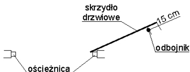
Rys. 2. Miejsce montażu odbojnika

10. Firma budowlana z osadzania drzwi o zwiększonej odporności na włamanie kl. A lub kl. B powinna wystawić użytkownikowi zaświadczenie z zabudowy stwierdzające, że zostały spełnione wszystkie zalecenia wynikające z niniejszej Aprobaty Technicznej oraz z instrukcji wbudowania i montażu - producenta. Zaświadczenie z zabudowy zaleca się przedkładać przedstawicielom towarzystw ubezpieczeniowych.